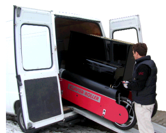
Chargement facile dans le camion avec la rampe alu