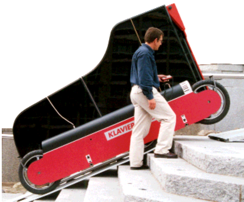
Le transport des pianos sans effort et en toute sécurité