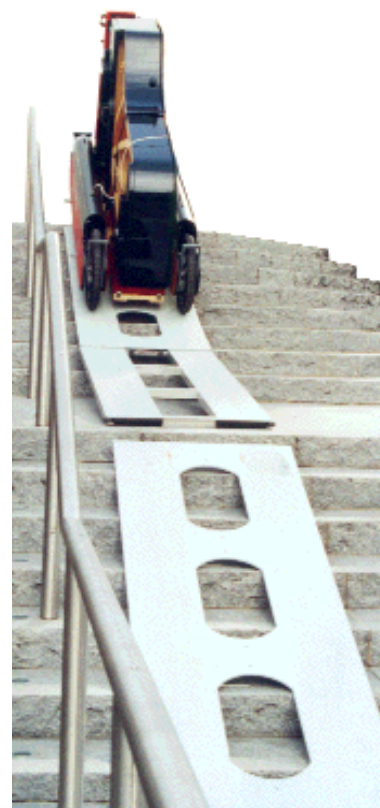
2 plateaux bois et une rampe alu pour monter tous types d'escaliers